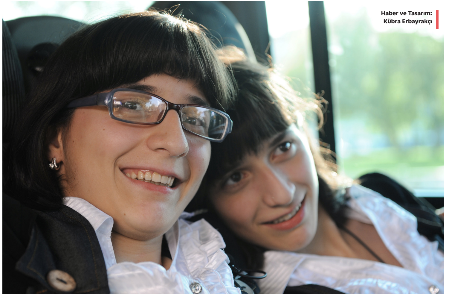
Haber ve Tasarım: Kübra Erbayrakçı